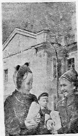
В честь праздника 1 Мая в детском саду масложиркомбината позавчера был проведен большой утренник. На снимке: дети после окончания утренника с подарками направляются домой.